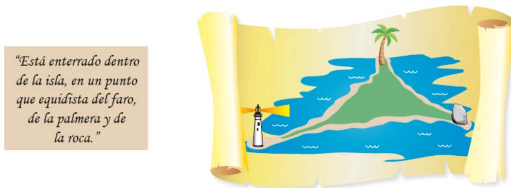
Figura 1. Dos tareas de matemáticas para 6o. grado

En ambos casos las actividades se prestan para trabajar en aula la lectura en Matemáticas. Una débil comprensión de lectura puede muchas veces resultar en un obstáculo para acceder a las explicaciones y mediaciones. Una forma concreta de apoyar este proceso es brindando acceso al vocabulario, lo que permite aliviar la carga cognitiva de la comprensión lectora. El lenguaje utilizado en los textos escolares de Matemáticas contiene muchas veces una fuerte densidad léxica (gran cantidad de palabras de contenido en relación con la cantidad total de palabras escritas), con palabras complejas, de baja frecuencia en la vida