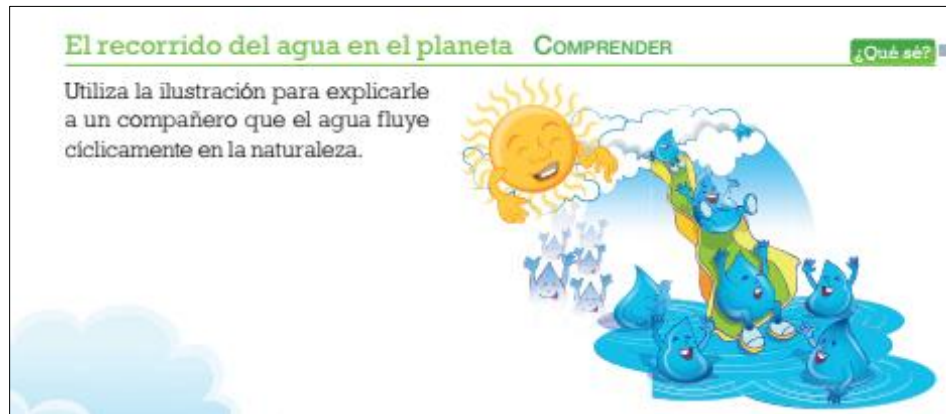
Figura 2. Consigna de Ciencias Naturales de 2o. grado en libro de texto para el estudiante

A continuación, se presenta el ejemplo de una consigna de ciencias de 2o. grado y su secuencia de lectura y escritura de acuerdo con el diseño didáctico propuesto. La figura 2 muestra la consigna presente en el libro de texto que utilizan los estudiantes, mientras que la tabla III detalla la secuencia didáctica propuesta al profesor en la guía del docente: